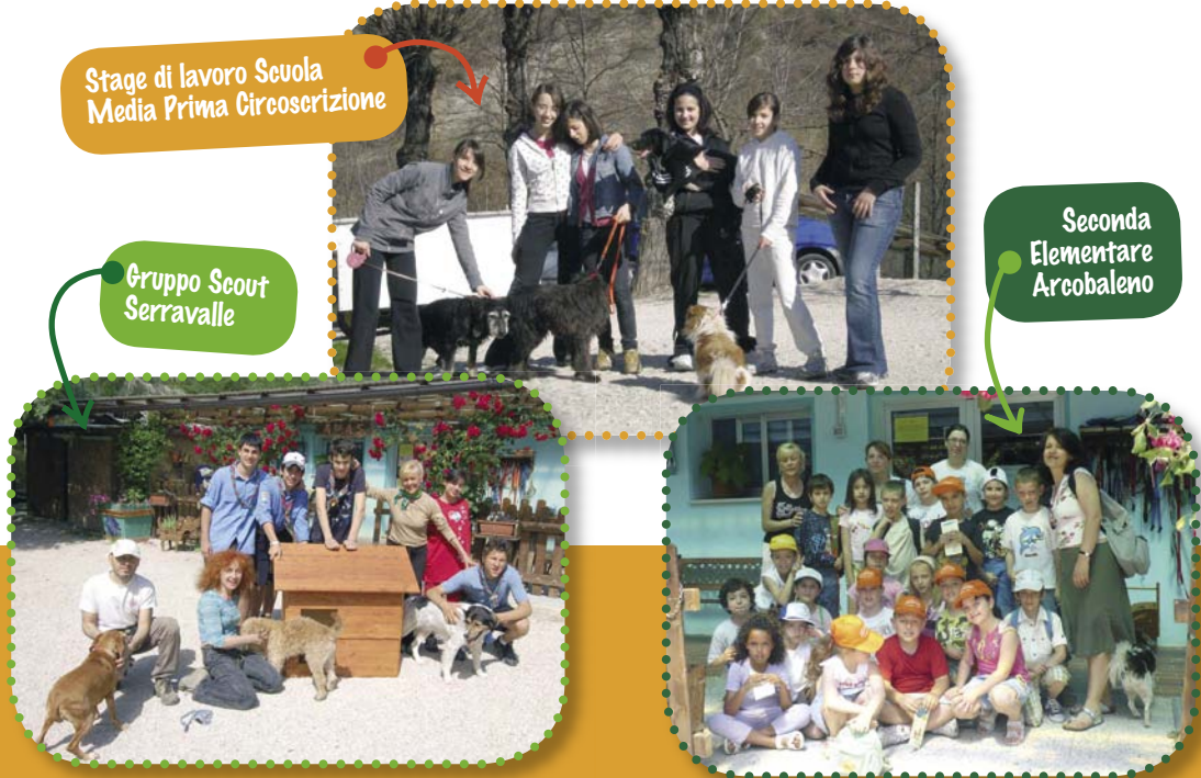
Seconda Elementare Arcobaleno