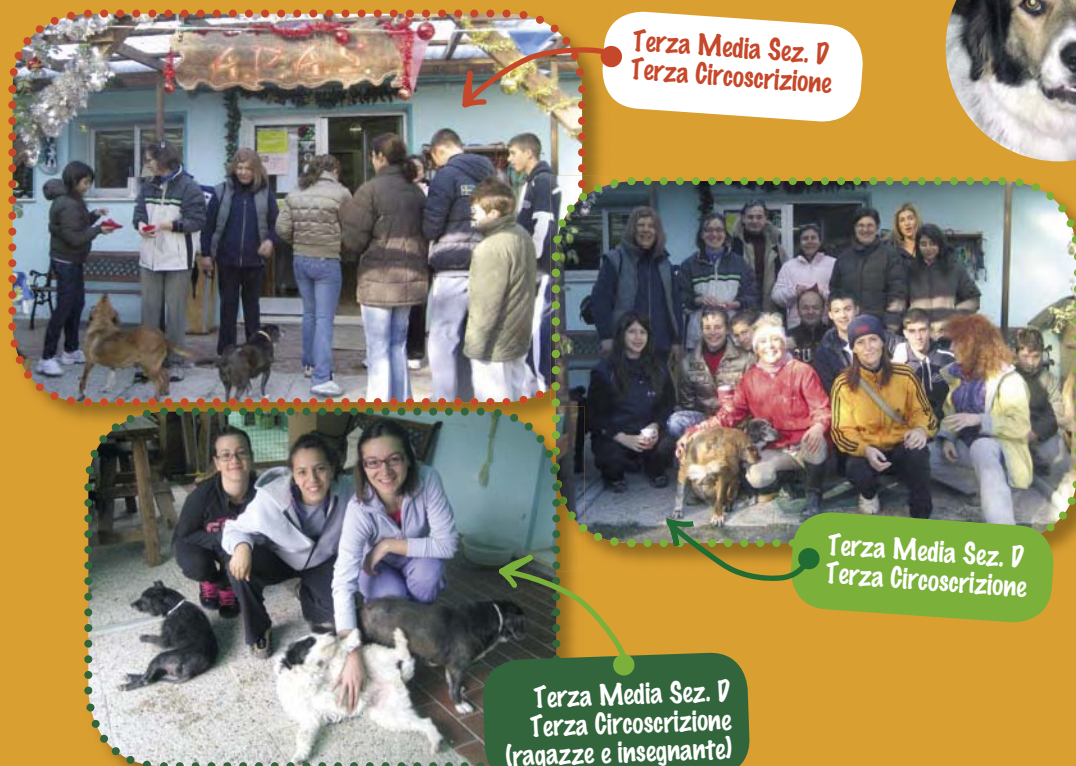
Terza Media Sez. D Terza Circostrizione (ragazze e insegnante)